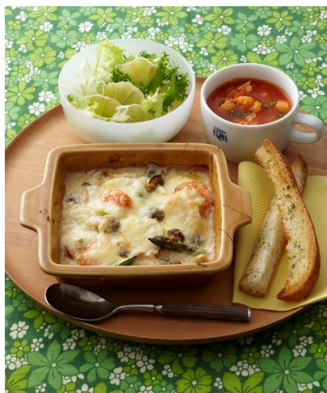
応募写真のイメージ2